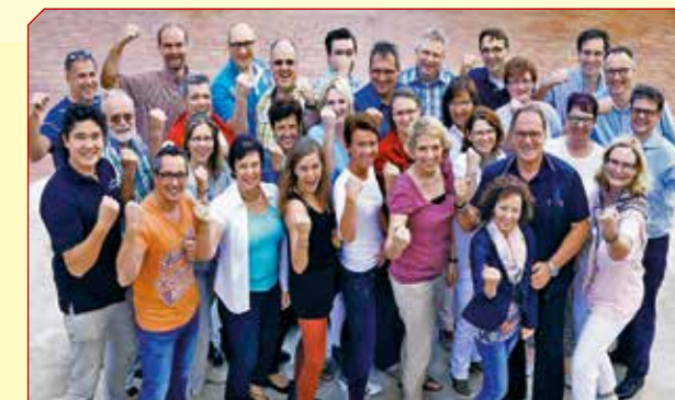
Inspirations-Seminar für Chefs und Mitarbeiter: „Das attraktive, zukunftsfähige Unternehmen gestalten“

+ Um die „Koalition der Erneuerer“ in ihrem Unternehmen zu stärken, empfehlen wir Ihnen, als Ergänzung, das 1-tägige Inspirations-Seminar „Das attraktive, zukunftsfähige Unternehmen gestalten“ für das gesamte Team.