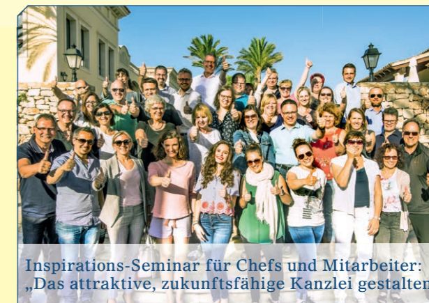
Inspirations-Seminar für Chefs und Mitarbeiter: „Das attraktive, zukunftsfähige Kanzlei gestalten“